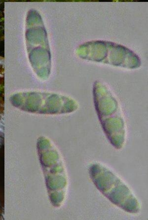
Saintes, décembre 2014, sous buis