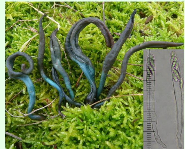
Janv. 2012 - sous genévriers à Gensac-la-Pallue (16). Asques 80-120 \mu\text{m} , la majorité supérieurs à 100 \mu\text{m} ; Spores 11,5-17 x 3,5-5 \mu\text{m} (observations dans l'eau).