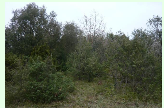
Janvier 2012 - Chaumes de Séchebec commune de St Savinien (17), sous genévriers. Microscopie (observations dans l'eau) : asques 75-102 \mu\text{m} , spores (12,5)15-18(20) x 3,5-4,5 \mu\text{m} .