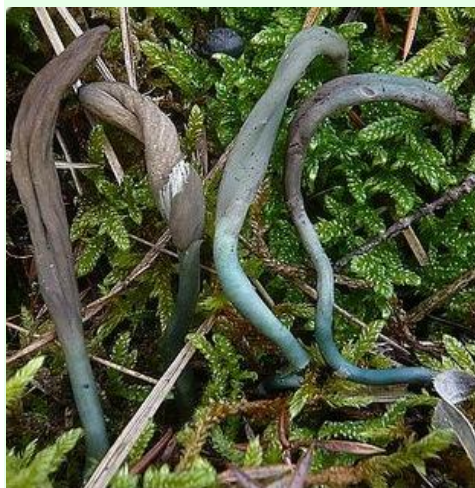
Janvier 2012 - Récoltes réalisées sur différents coteaux calcaires à orchidées avec genévriers, entre Pons et Bougneau (17). Microscopie (observations dans l'eau) : asques 62-100 \mu\text{m} ; spores 11,5-17(20) x 3,5-5 \mu\text{m} .