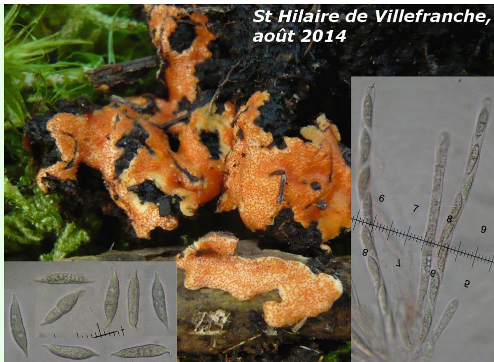
St Hilaire de Villefranche, août 2014