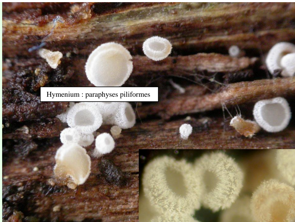
Hymenium : paraphyses piliformes