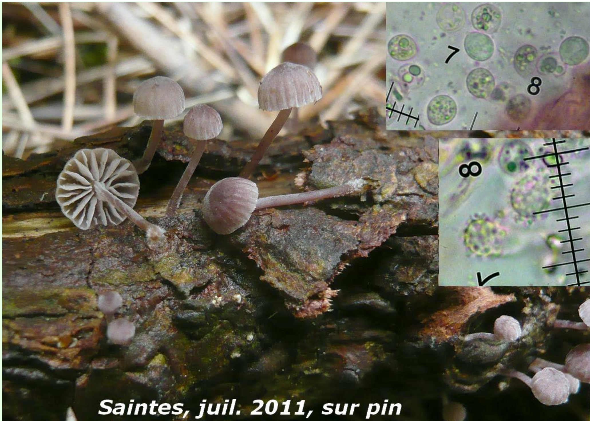
Saintes, juil. 2011, sur pin