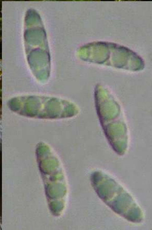
Saintes, décembre 2014, sous buis