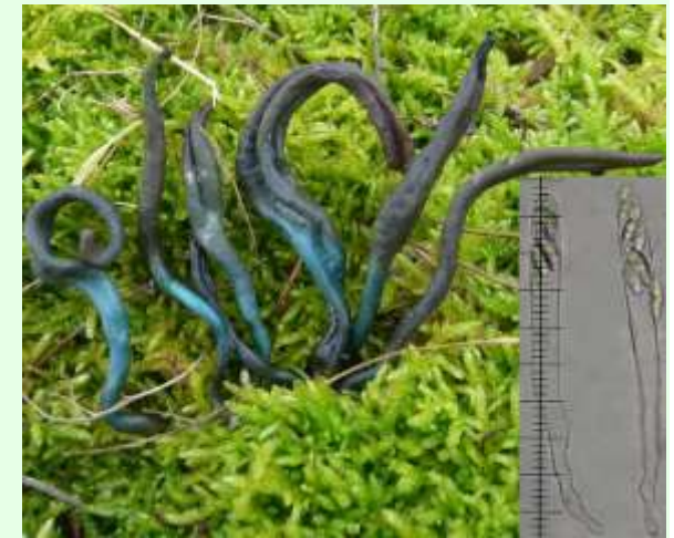
Janv. 2012 - sous genévriers à Gensac-la-Pallue (16). Asques 80-120 \mu\text{m} , la majorité supérieurs à 100 \mu\text{m} ; Spores 11,5-17 x 3,5-5 \mu\text{m} (observations dans l'eau).