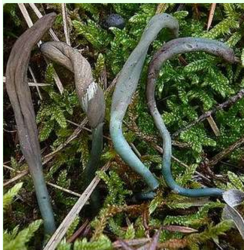
Janvier 2012 - Récoltes réalisées sur différents coteaux calcaires à orchidées avec genévriers, entre Pons et Bougneau (17). Microscopie (observations dans l'eau) : asques 62-100 \mu\text{m} ; spores 11,5-17(20) x 3,5-5 \mu\text{m} .