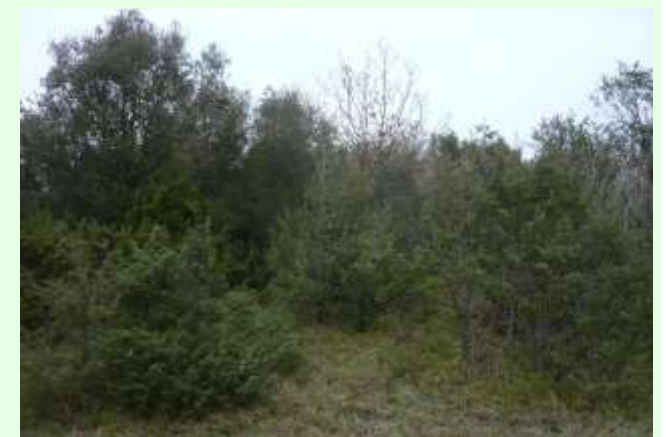
Janvier 2012 - Chaumes de Séchebec commune de St Savinien (17), sous genévriers. Microscopie (observations dans l'eau) : asques 75-102 \mu\text{m} , spores (12,5)15-18(20) x 3,5-4,5 \mu\text{m} .