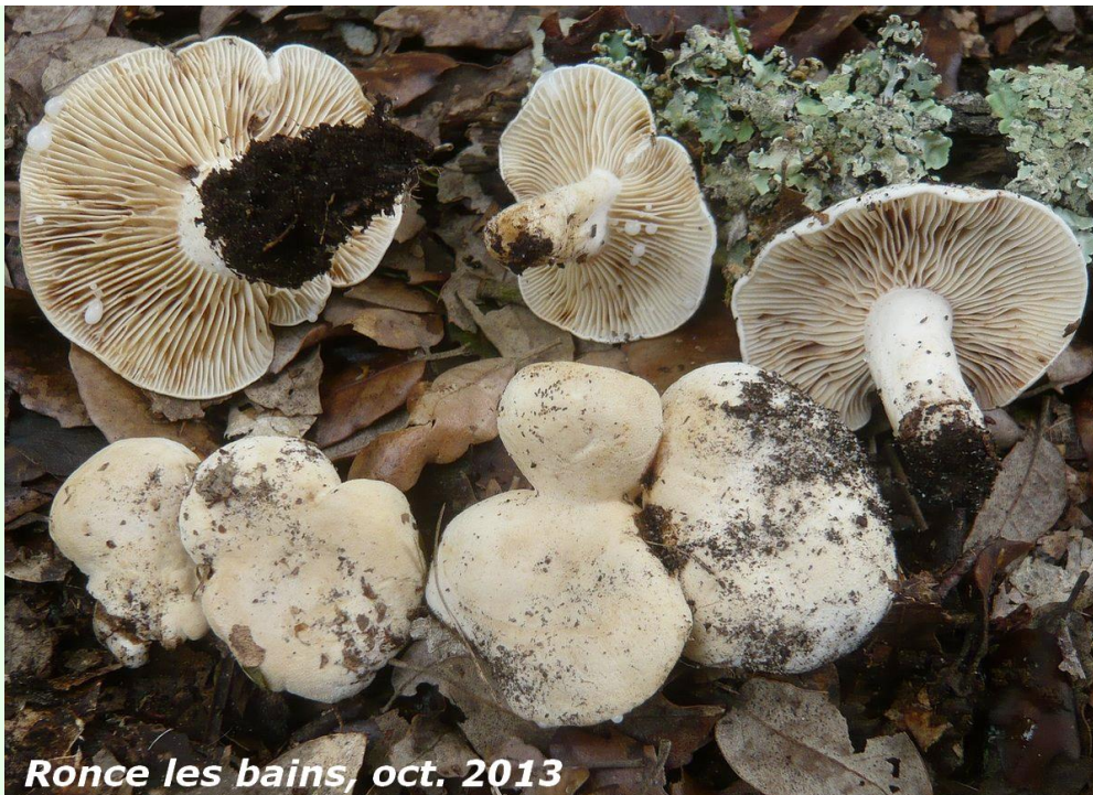
Ronce les bains, oct. 2013