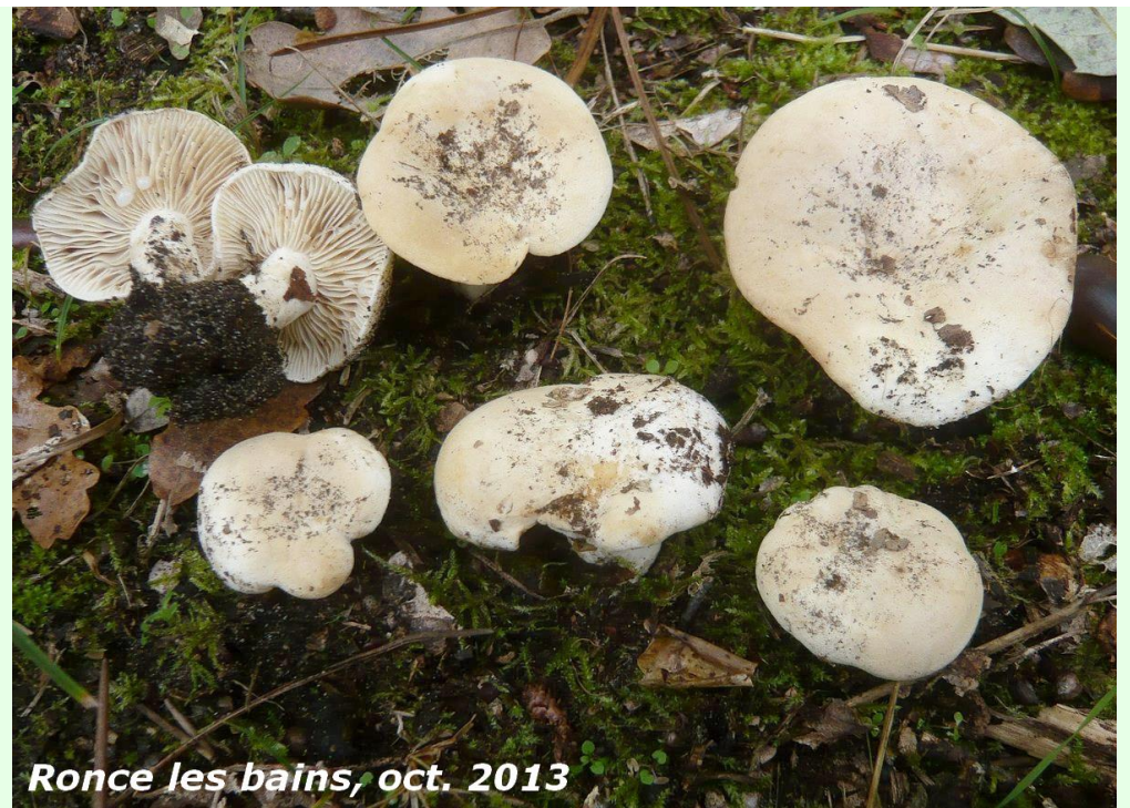
Ronce les bains, oct. 2013