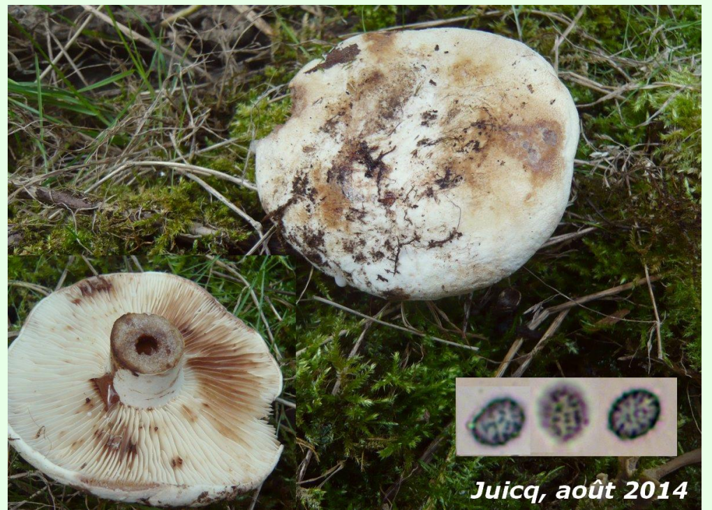
Juicq, août 2014