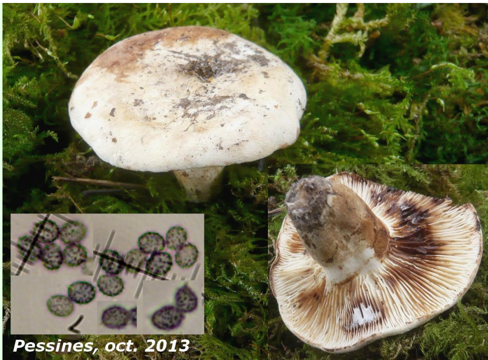
Pessines, oct. 2013