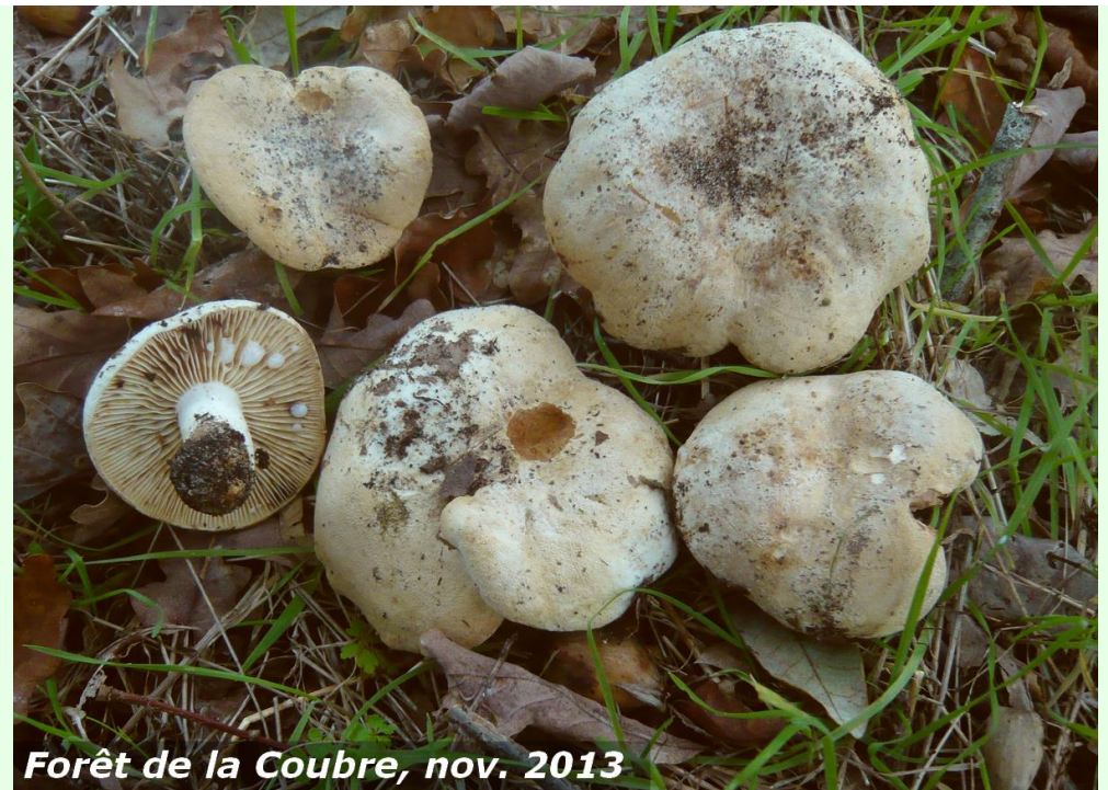
Forêt de la Coubre, nov. 2013