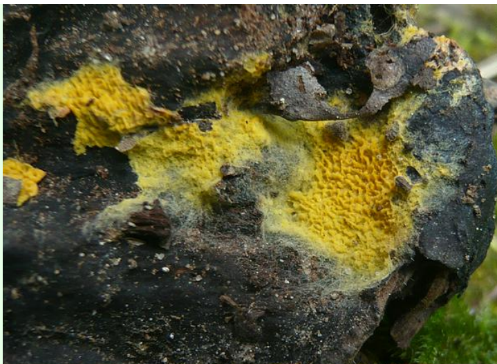
Port d'Envaux, août 2014