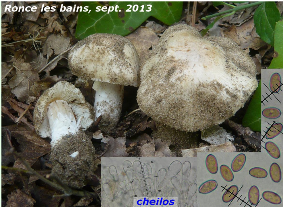
Ronce les bains, sept. 2013