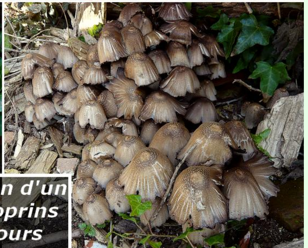
Evolution d'un lot de coprins sur 5 jours