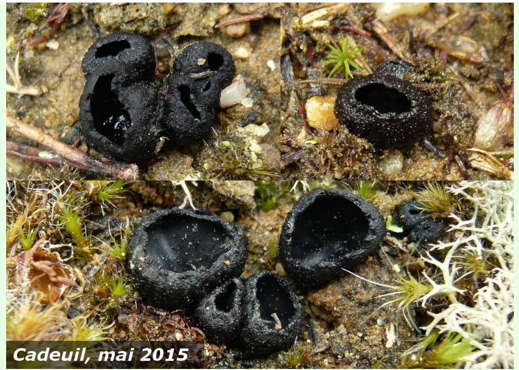
Cadeuil, mai 2015