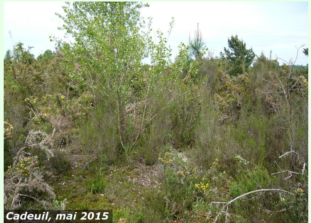
Cadeuil, mai 2015