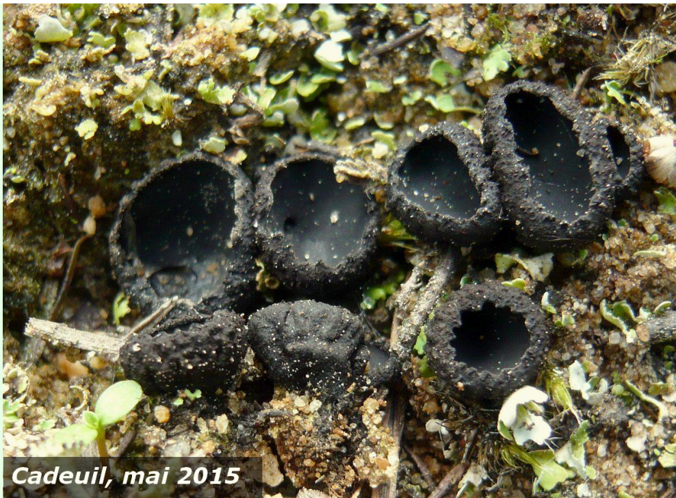
Cadeuil, mai 2015