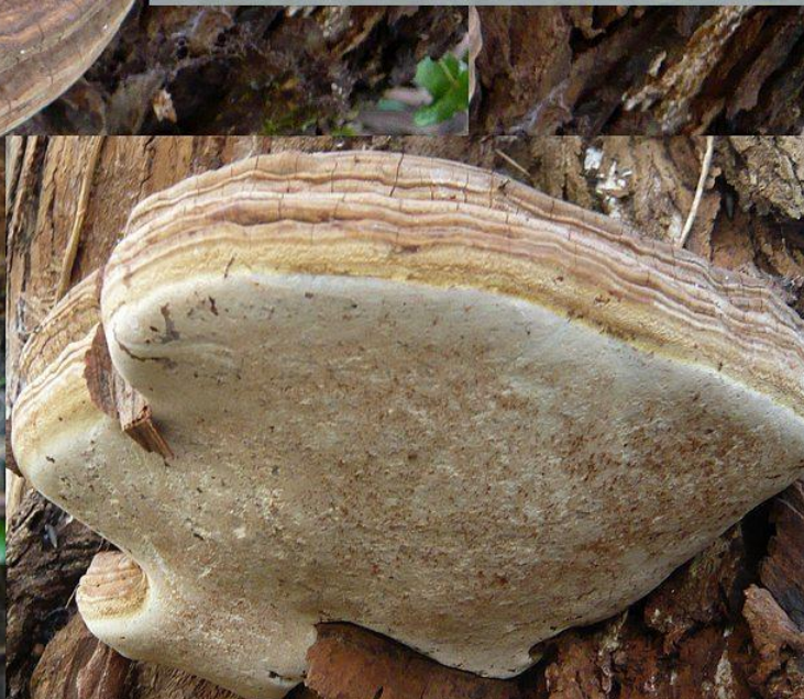
Sur Eucalyptus sur l'île d'Aix, déc. 2015